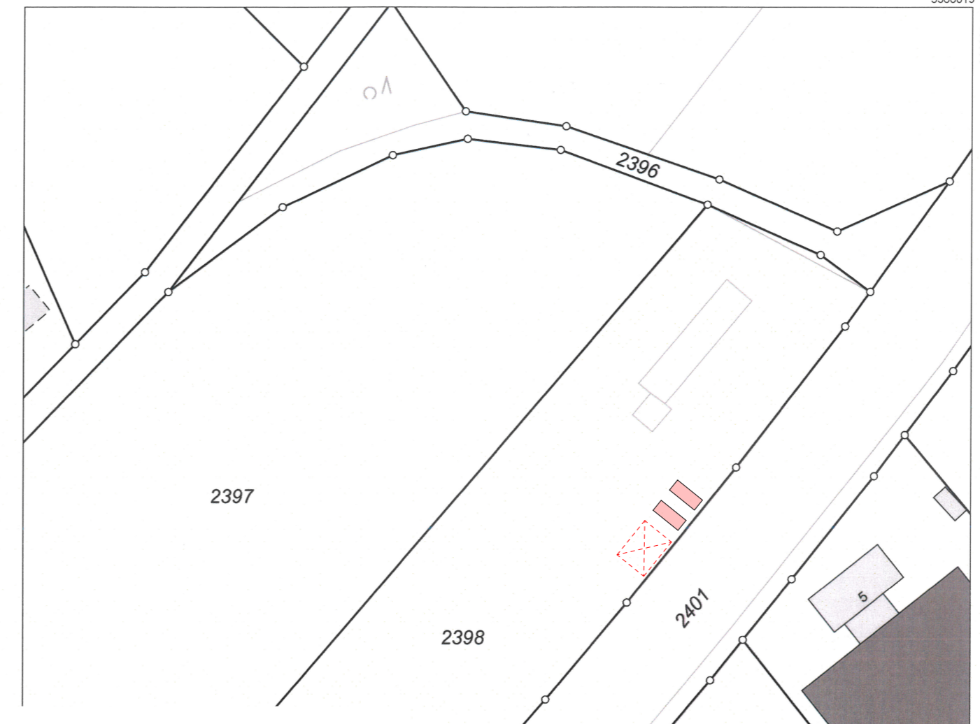
Lageplan M 1-1000

Amt für Digitalisierung, Breitband und Vermessung Aichach Münchener Straße 7 86551 Aichach Auszug aus dem Liegenschaftskataster Flurkarte 1:1000 zur Bauvorlage nach § 7 Abs. 1 BauVorlV Erstellt am 03.03.2025 Flurstück: 2398 Gemarkung: Ecknach Gemeinde: Aichach Landkreis: Aichach-Friedberg Bezirk: Schwaben